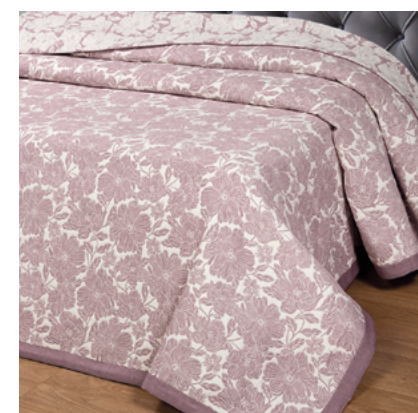
Танец цветов (фиолетовое)