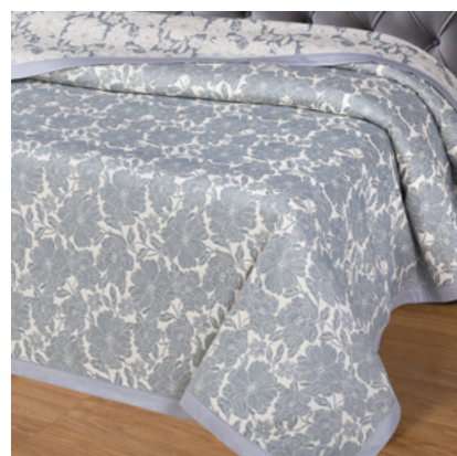
Танец цветов (сине-серое)