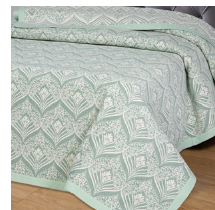
Сады востока (зеленое)