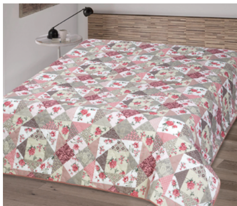
Лоскутная мозайка (розовая)